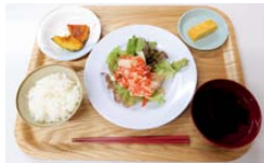
美味しい食事付き！