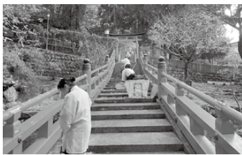
末一稻荷神社太鼓橋の清掃

を聴かされていたほどです。しかし、皆さんが想像するような感じではなく両親は喧嘩ばかりで幼い時は妹と違う部屋に逃(7頁に続く)