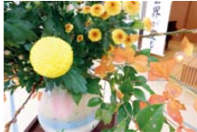
会場に飾られたお花☆