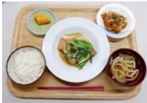
美味しい食事付き!