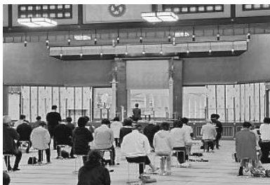
早朝行事 聖經読誦

(3頁から続く) いでした。彼の、人生の目的を失くしたような虚ろな顔を見ると、親としていたたまれない気持ちになりました。もう一つの理由は、私自身の建設業の事業が大きな転換期を迎えており、今後物価高の中、どのような舵取りをすれば良いのか悩んでいました。妻からの勧めもあり長男と二人で参加しました。