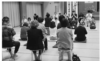
祈り合いの神想観

娘一家が昨年に引き続き練成会に参加するため、私も一緒に来ることにしました。主人と夫婦喧嘩中、夫の検査入院、息子の再検査、私の手指の痛みなど、何かもやもやしていたので思い